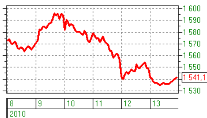
— Динамика ММВБ с 8 по 13 ноября

Однако к середине недели рост сменился на спад, в связи с негативом, идущим из-за рубежа. По итогам недели индекс РТС вырос на 0,74%, индекс ММВБ снизился на 0,3%.